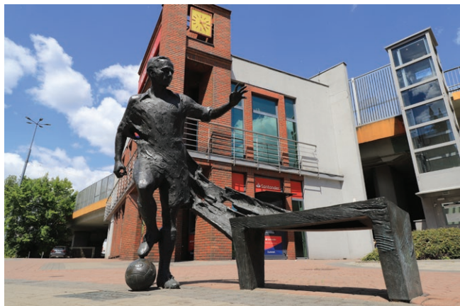
Lawka–Pomnik Gerarda Cieřlika, legendarnego piłkarza Ru- chu Chorzów przed budynkiem Poczty Główniej w Chorzowie

W 1939 roku Chorzów został zajęty przez Niemców, a w czasie wojny działały tu zakłady zbrojeniowe oraz przymusowe obozy pracy. Po wojnie Chorzów nadal był jednym z kluczowych ośrodków przemysłowych Polski. Działały tu m.in.: Huta Kościuszko, Huta Batory, Zakłady Koksochemiczne Hajduki, Zakłady Azotowe, Kopalnie Barbara i Prezydent oraz Konstal. Po transformacji ustrojowej w latach 90. XX wieku większość przemysłu ciężkiego upadła lub została zrestrukturyzowana. Dziś, to miasto usług, kultury i rekreacji. Jest jednym z najbardziej rozpoznawalnych miejsc w Polsce.