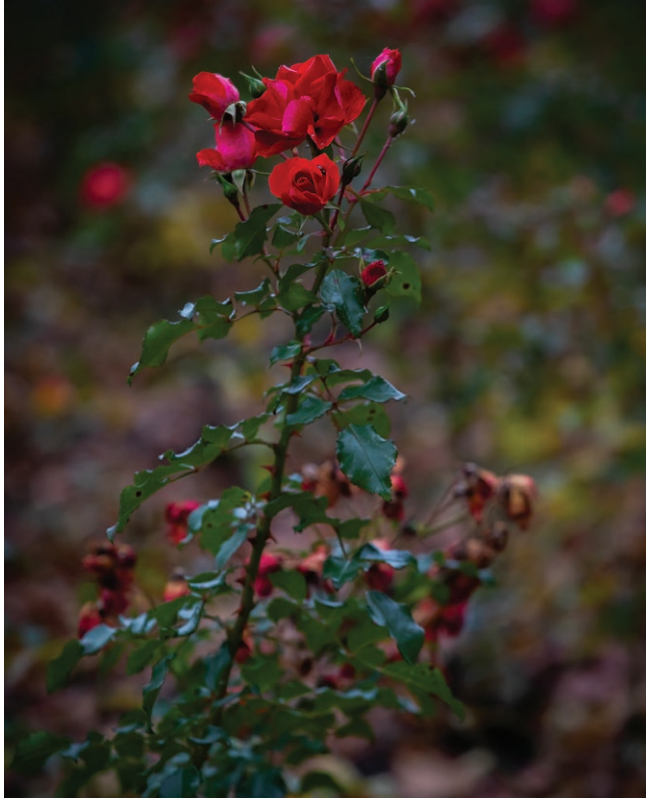
Rosarium w Parku Śląskim Fot. Marek Śliwiński, 2025 r.

nowe odmiany róż. To jedno z najpiękniejszych i najbardziej romantycznych miejsc w całym regionie, będące miejscem spotkań i sesji zdjęciowych, gdzie do dziś wiele par robi tu zdjęcia ślubne. Obecnie Rosarium w Parku Śląskim jest największym rosarium w kraju i jednym z największych w Europie Środkowej. To również miejsce koncertów muzyki poważnej i jazzowej, a także miejsce plenerów artystycznych i wystaw florystycznych. To miejsce, gdzie przemysłowy kiedyś region, pokazuje swoje delikatne, pełne kolorów i zapachów kwitnące oblicze.