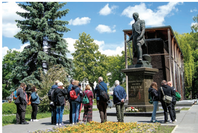
Uczestnicy Forum na rynku w Chorzowie przed pomnikiem Fryderyka Wilhelma von Redena Fot. Piotr Kopicki, 2025 r.

Schron dowodzenia: W 1938 roku został wybudowany schron, z przeznaczeniem na siedzibę sztabu pułku fortecznego. Schron był samowystarczalny, gazoszczelny, posiadał pełną instalację elektryczną i wentylację pomieszczeń. Wyremontowany w latach 2009-2012 i udostępniony zwiedzającym.