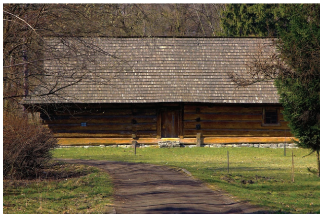
Chalupa groniowa ze Świerczyńca w Górnośląskim Parku Etnograficznym w Chorzowie Fot. Wieńczysława Słowińska, 2025 r.

Górnośląski Park Etnograficzny (Skansen): budowę rozpoczęto w 1964 roku, a pierwsze obiekty udostępniono do zwiedzania w roku 1975. Na ok 22 ha możemy zobaczyć ponad 80 zabytkowych budynków. To „żywa wieś”, gdzie wszystkie budynki są autentyczne, przewiezione z prawdziwych miejscowości. Możemy zobaczyć zagrody