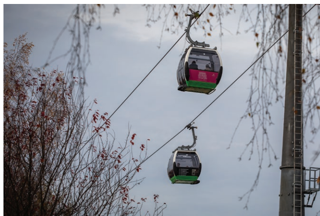
Elka w Parku Śląskim Fot. Marek Śliwiński, 2025 r.

Miasteczko – Planetarium – Stadion Śląski. Cała długość miała 5,5 km. W 2006 r. została wyłączona z użytkowania ze względu na zły stan techniczny. Ponownie uruchomiono nową ELKĘ 8 września 2013 r., a właściwie jej pierwszy odcinek: Stadion Śląski – Wesołe Miasteczko (długość 2,185 m). W grudniu 2023 r. uruchomiono drugi odcinek: Wesołe Miasteczko – Planetarium (1,714 m). Obecnie czekamy na ukończenie prac związanych z uruchomieniem trzeciej linii: Planetarium – Stadion Śląski, dzięki czemu kolejka powróci do historycznego układu