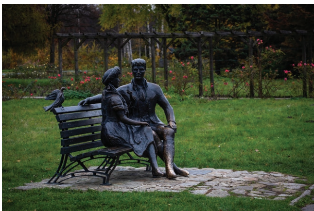
Ławeczka Karolinki i Karlika w Rosarium w Chorzowie

nowe odmiany róż. To jedno z najpiękniejszych i najbardziej romantycznych miejsc w całym regionie, będące miejscem spotkań i sesji zdjęciowych, gdzie do dziś wiele par robi tu zdjęcia ślubne. Obecnie Rosarium w Parku Śląskim jest największym rosarium w kraju i jednym z największych w Europie Środkowej. To również miejsce koncertów muzyki poważnej i jazzowej, a także miejsce plenerów artystycznych i wystaw florystycznych. To miejsce, gdzie przemysłowy kiedyś region, pokazuje swoje delikatne, pełne kolorów i zapachów kwitnące oblicze.