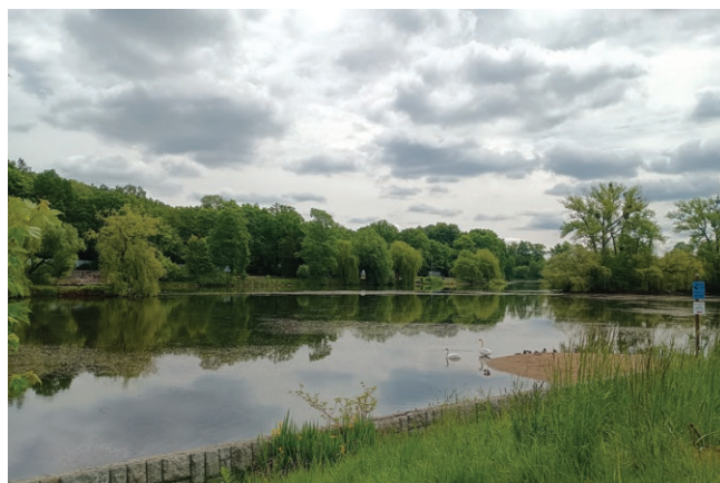
Park Śląski Fot. Michalina Kraszkiewicz, 2025 r.

Planetarium Śląskie (1955 r.): pierwsze tego typu w Polsce, wyposażone w największy w kraju refraktor o średnicy 30 cm. Sala projekcyjna mogła pomieścić 400 widzów, wyposażona w płócienny sferyczny ekran o pow. 1000 m 2 , a w centralnym punkcie umieszczono najnowocześniejszy w tym czasie projektor Carla Zeisla mogący wyświetlić na sztucznym niebie ponad 8000