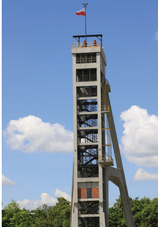
Wieża wyciągowa szybu Prezydent w Chorzowie Fot. Marek Lawin, 2025 r.

przedstawiającą przemysł hutniczy, zarówno dla dzieci jak i dorosłych.