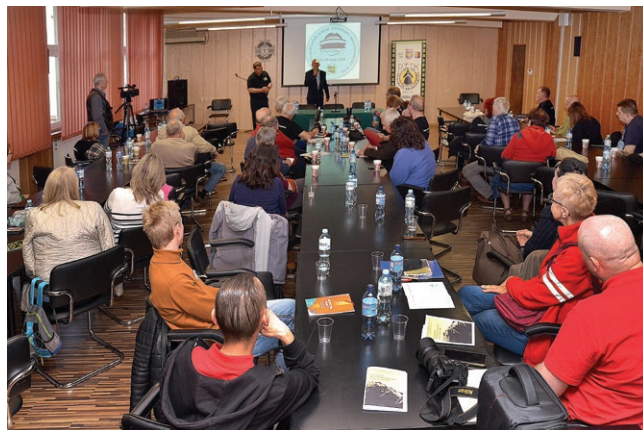
Uczestnicy podczas otwarcia Forum Fotografii Krajoznawczej w Chorzowie Fot. Czesław Polański, 2025 r.

Marii Skłodowskiej-Curie w Chorzowie Pana Artura Jądwińczoka. Były to trzy dni pełne wrażeń, odznaczeń, prelekcji, prezentacji i pokazów zdjęć. W ramach Forum odbyło się również zebranie Komisji Fotografii Krajoznawczej ZG PTTK oraz obrady instruktorskie i mianowanie nowego Instruktora Fotografii.