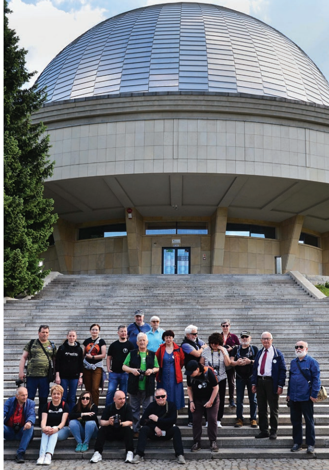
Uczestnicy Forum Fotografii Krajoznawczej przed planetarium w Chorzowie

Park Śląski: kiedyś Wojewódzki Park Kultury i Wypoczynku, obecnie Tauron Park Śląski. Decyzję o budowie Parku podjęto w grudniu 1950 roku z inicjatywy gen. Jerzego Ziętka. Historia Parku jest związana z powojenną odbudową Górnego Śląska i wizją stworzenia tzw. „zielonych płuc” dla uprzemysłowionego regionu. W efekcie stworzono na powierzchni ok. 535 ha jeden z największych tego typu w Europie, kompleks rekreacyjny i przyrodniczy, który dał mieszkańcom miejsce odpoczynku.