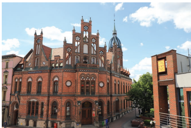
Budynek Poczty Głównej w Chorzowie

Budynek Poczty Polskiej: wybudowano w latach 1891-1892, projektu Johanna Schuberta. Zbudowany na planie nieregularnym, wzniesiony w stylu neogotyckim, dwukondygnacyjny. Dachy są tu wielospadowe z lukarnami, kryte dachówką. Budynek posiada wieżę na planie ośmioboku, a otwory okienne dekorowane są naprzemiennie ceglami w kolorze czerwonym i zielonym.