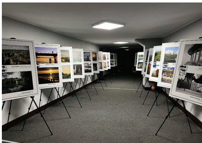
Wystawa „Krajobraz w obiektywie” przygotowana przez Centrum Fotografii Krajoznawczej PTTK Fot. Michalina Kraszkiewicz, 2025 r.