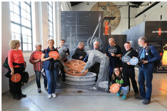
Uczestnicy Forum podczas zwiedzania Muzeum Hutnictwa w Chorzowie Fot. Marek Lawin, 2025 r.

Muzeum Hutnictwa: oddane do użytku w listopadzie 2021r. Mieści się w dawnych budynkach Huty Kościuszko. Jest to nowoczesna placówka muzealna z interaktywną, multimedialną wystawą w przystępny sposób