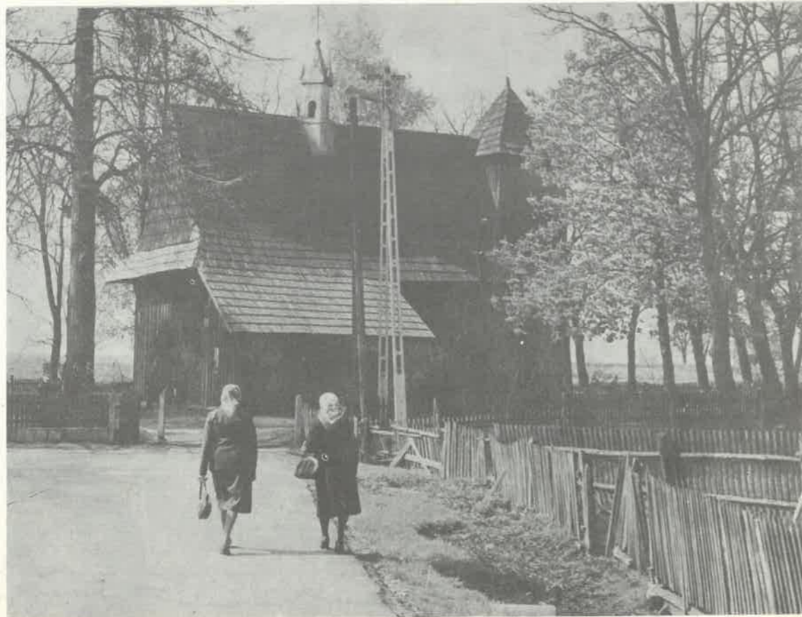
Kościół XVI-wieczny w Grąbieniu