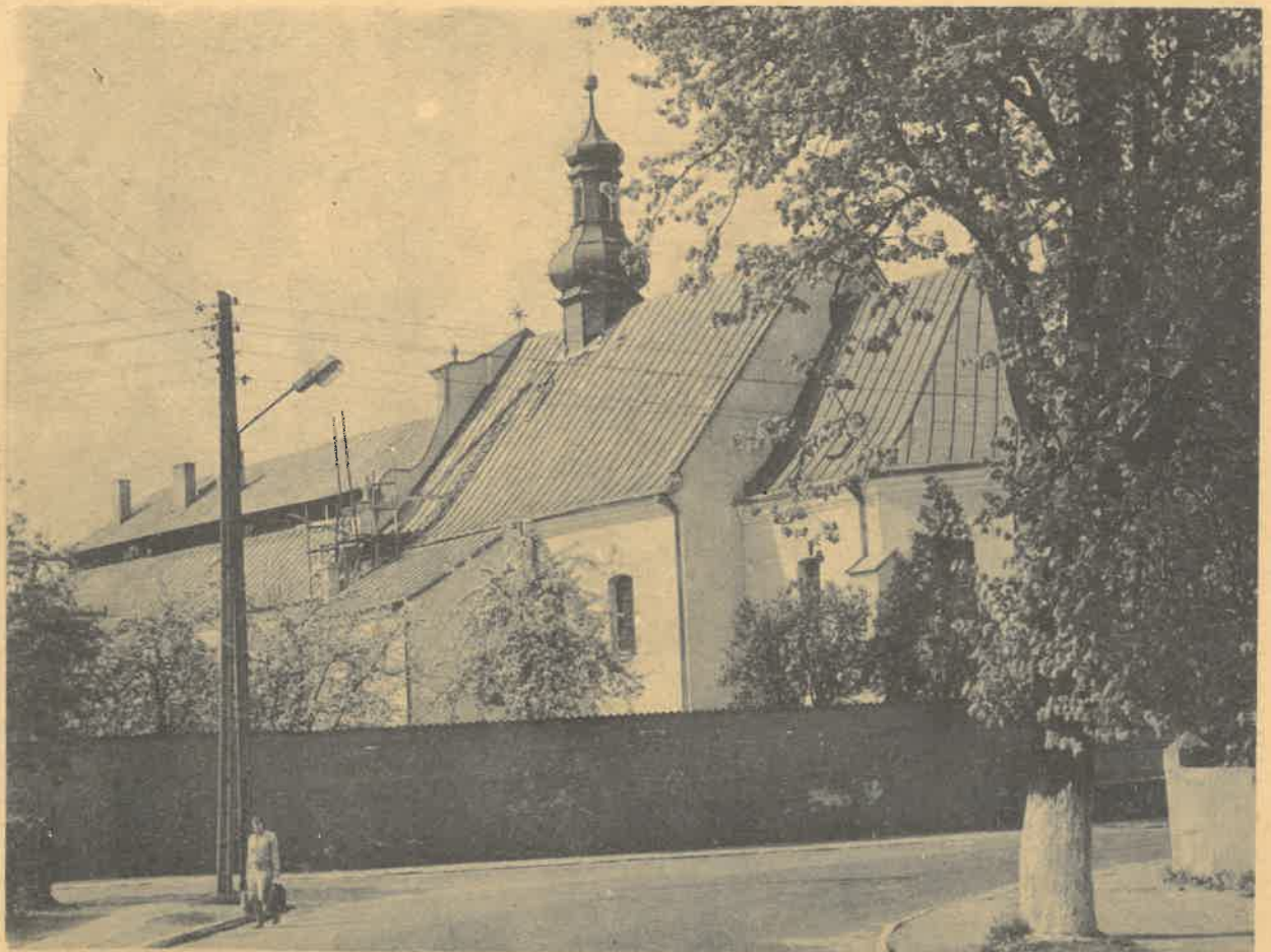
Kościół Bernardynek w Wieluniu