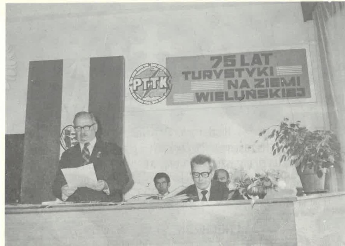
Uroczystości jubileuszu 75-lecia krajoznawstwa i turystyki w Wieluniu

Ośrodek zdrowia. Mokrsko dość długo czekało na własny ośrodek zdrowia, który został wybudowany dopiero w 1969 roku. Koszt budowy wynosił 2 200 tysięcy złotych. Obecnie należy do Zespołu Opieki Zdrowotnej w Wieluniu. Pełni funkcje Gminnego Ośrodka Zdrowia. Zatrudnia lekarzy medycyny, stomatologa, położną, cztery pielęgniarki i personel pomocniczy. Rejon ośrodka obejmuje 4 500 osób. Rocznie udziela się 14 500 porad. W okresie nasilenia zachorowań przyjmuje się dziennie i 66 pacjentów. Do najczęściej spotykanych chorób należą: gościec i choroby układu oddechowego. Jako osiągnięcie lekarz podaje brak zgonów wśród dzieci do roku życia. Ośrodek prowadzi działalność profilaktyczną wśród dzieci i dorosłych na miejscu i w środowisku. Od 1973 roku ludność wiejska korzysta z bezpłatnej opieki lekarskiej. Stałą opieką lekarską objęta jest również młodzież szkolna. Obecnie ośrodek rozbudowuje się. Będzie wyposażony w nowoczesne urządzenia i przy-