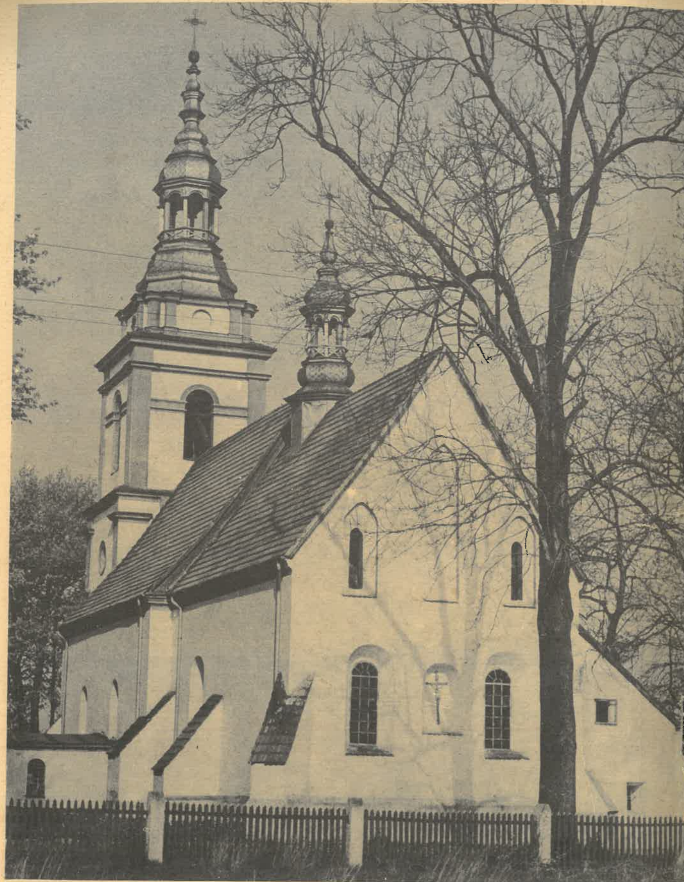
Późnorenesansowy kościół w Mokrsku

Obchodów Jubileuszu 75-lecia Krajoznawstwa i Turystyki na Ziemi Wieluńskiej 1908 - 1983