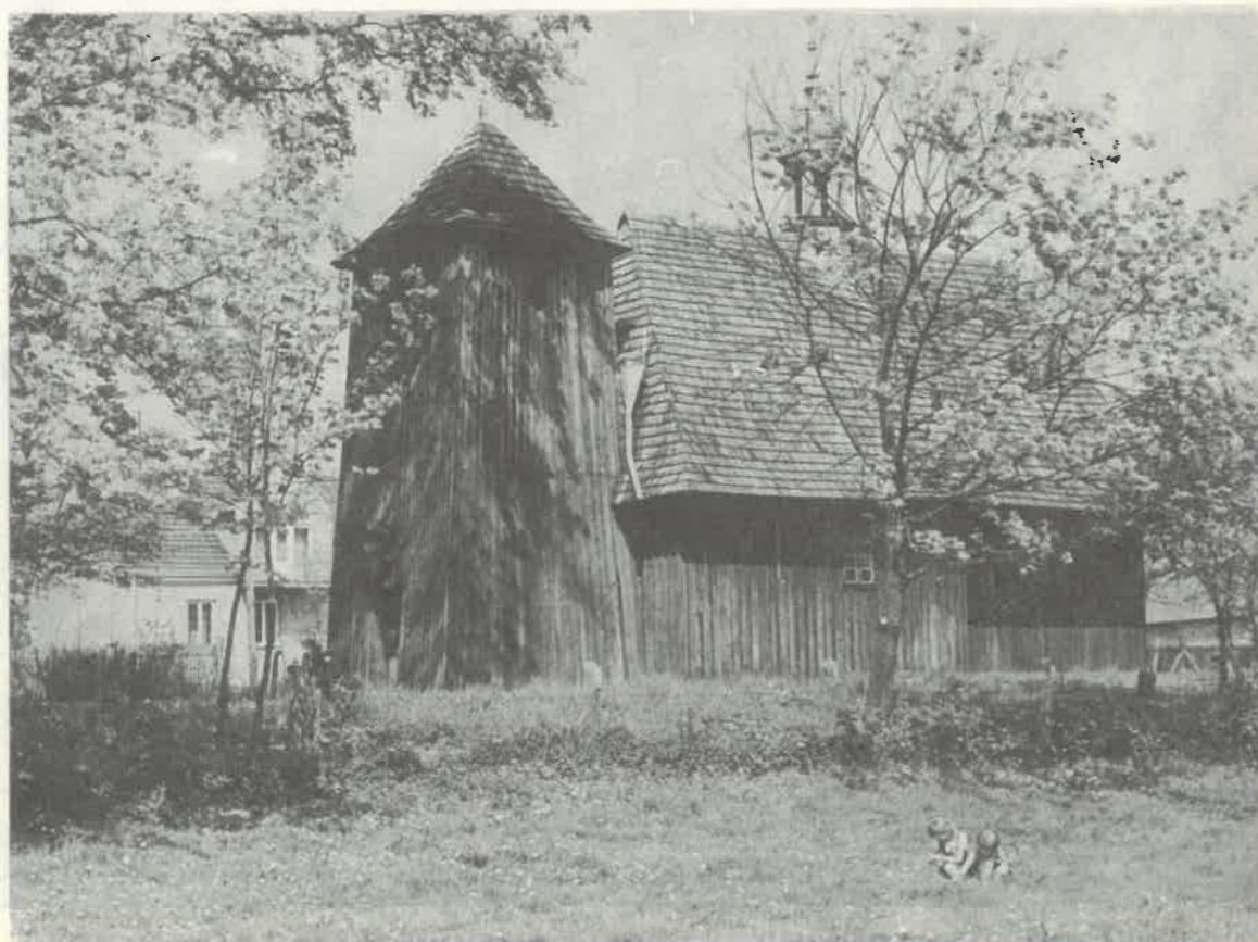
Kościół XVI-wieczny w Gaszynie

chodnie. Znajdzie się miejsce i na aptekę, której odczuwa się brak.