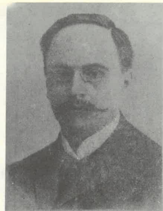
Stanisław Graeve (1868—1912)