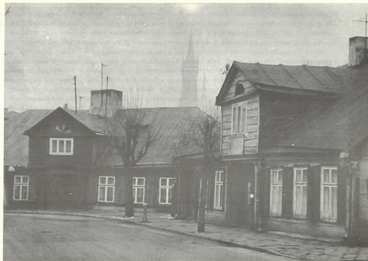
Domki tkaczy w Zgierzu przy ul. Dąbrowskiego