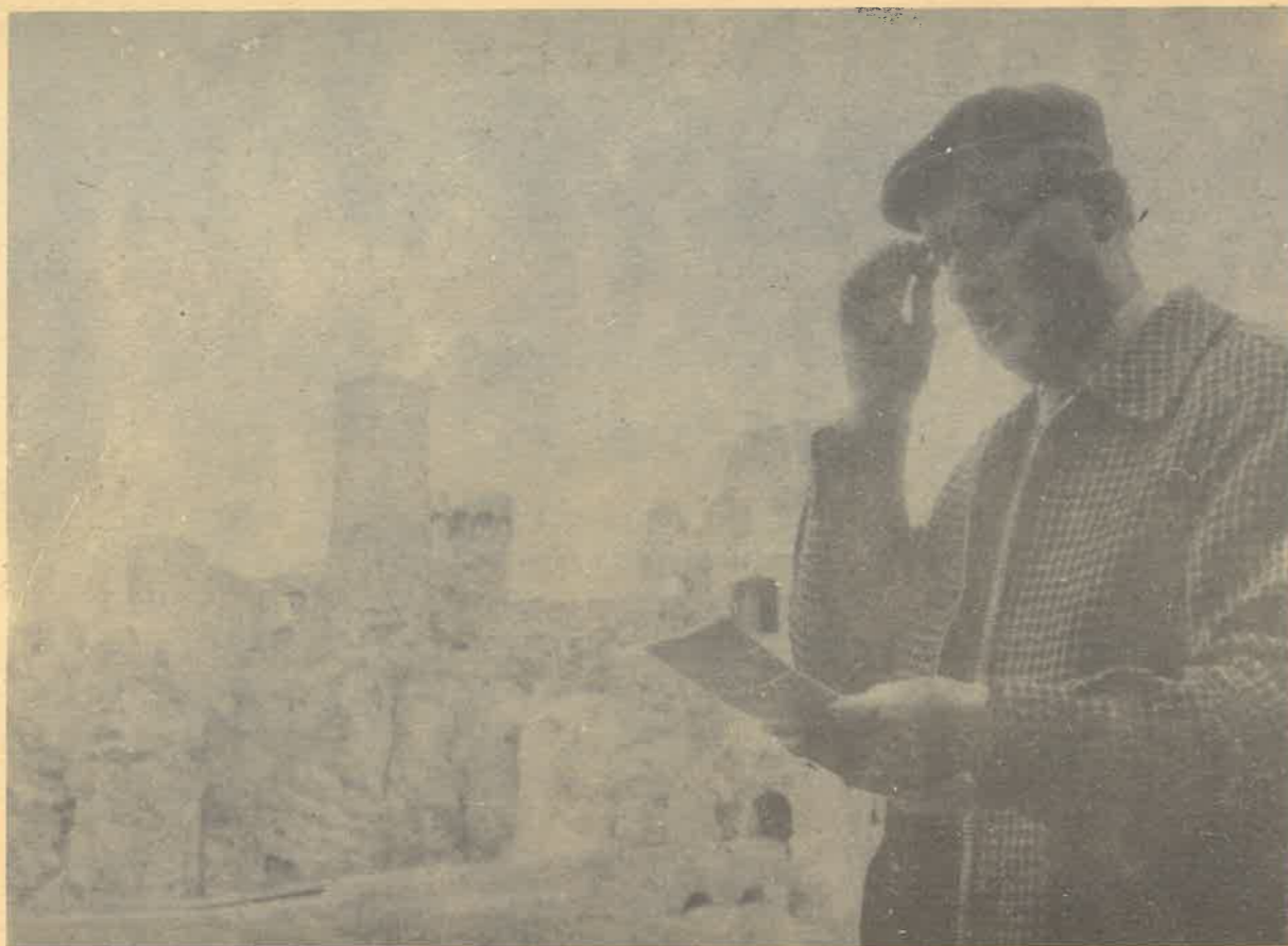
Na wycieczce szkoleniowej opiekunów SKKT-PTTK w 1982 r.