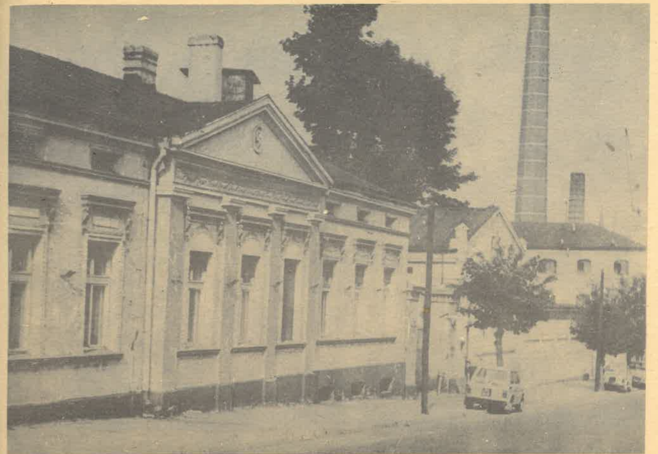
XIX-wieczna architektura przemysłowa Zgierza