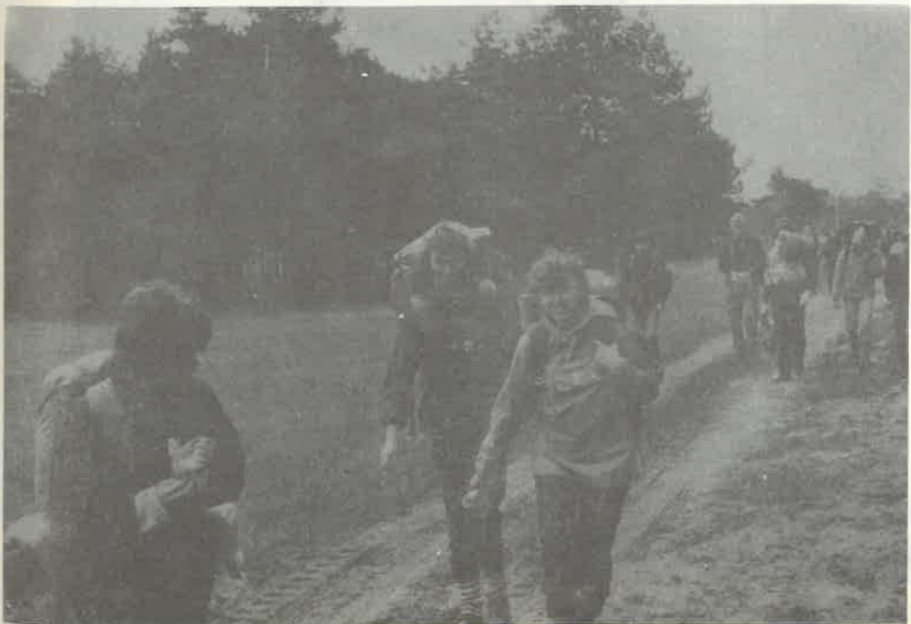
SKKT-PTTK przy LO im. Słazica na „Jurajskiej Jesieni 84”