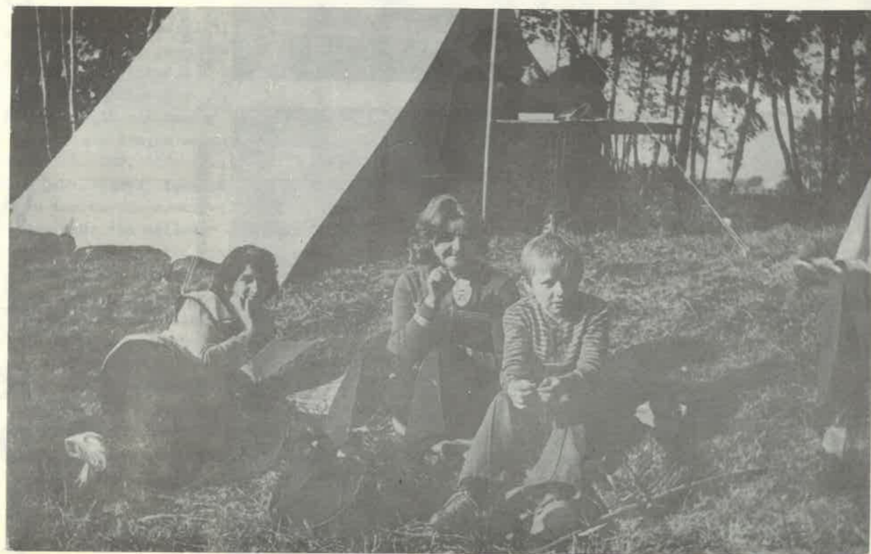
Koło PTTK nr 14 przy ZOZ na rajdzie „Powitanie Jesieni 75”