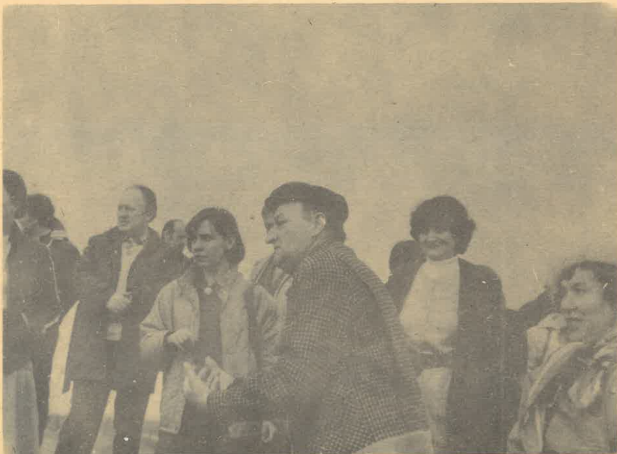
Na wycieczce szkoleniowej opiekunów SKKT-PTTK w 1982 r.