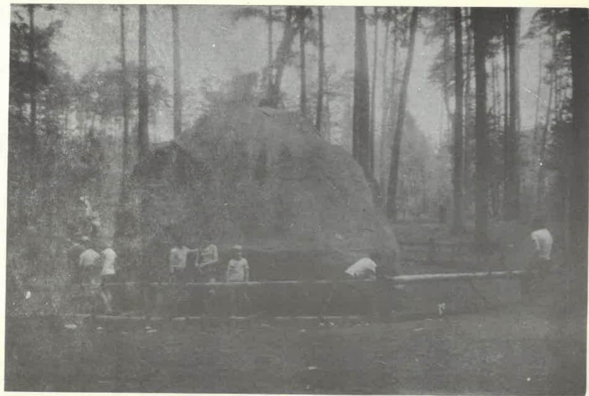
SKKT-PTTK przy SP nr 6 na wycieczce w Gołuchowie