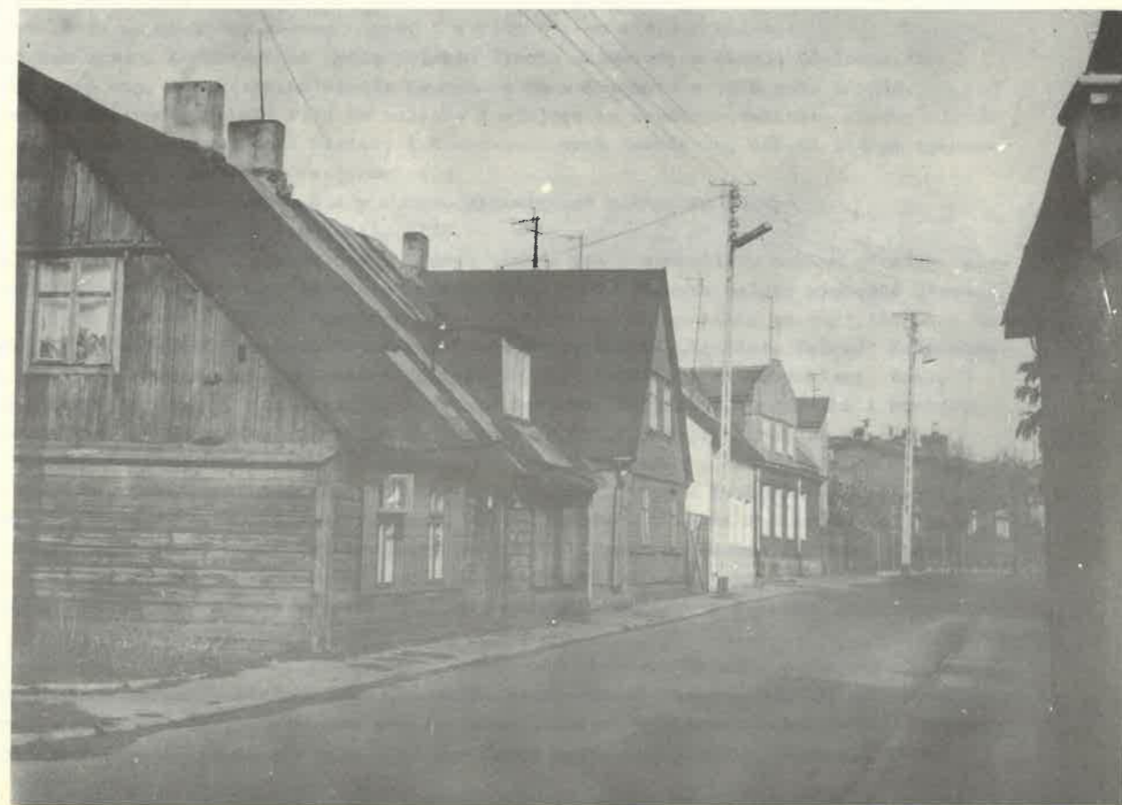
przy ul. 22 lipca