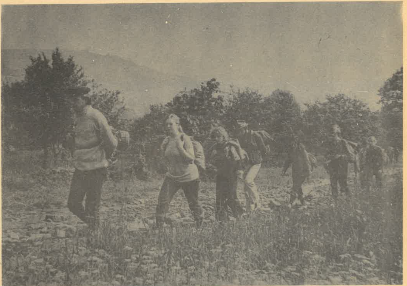
LO im. Staszica w Zgierzu na rajdzie w Gorcach (1974 r.)

Rok XXIX Maj-czerwiec 1984 Nr III/291|84