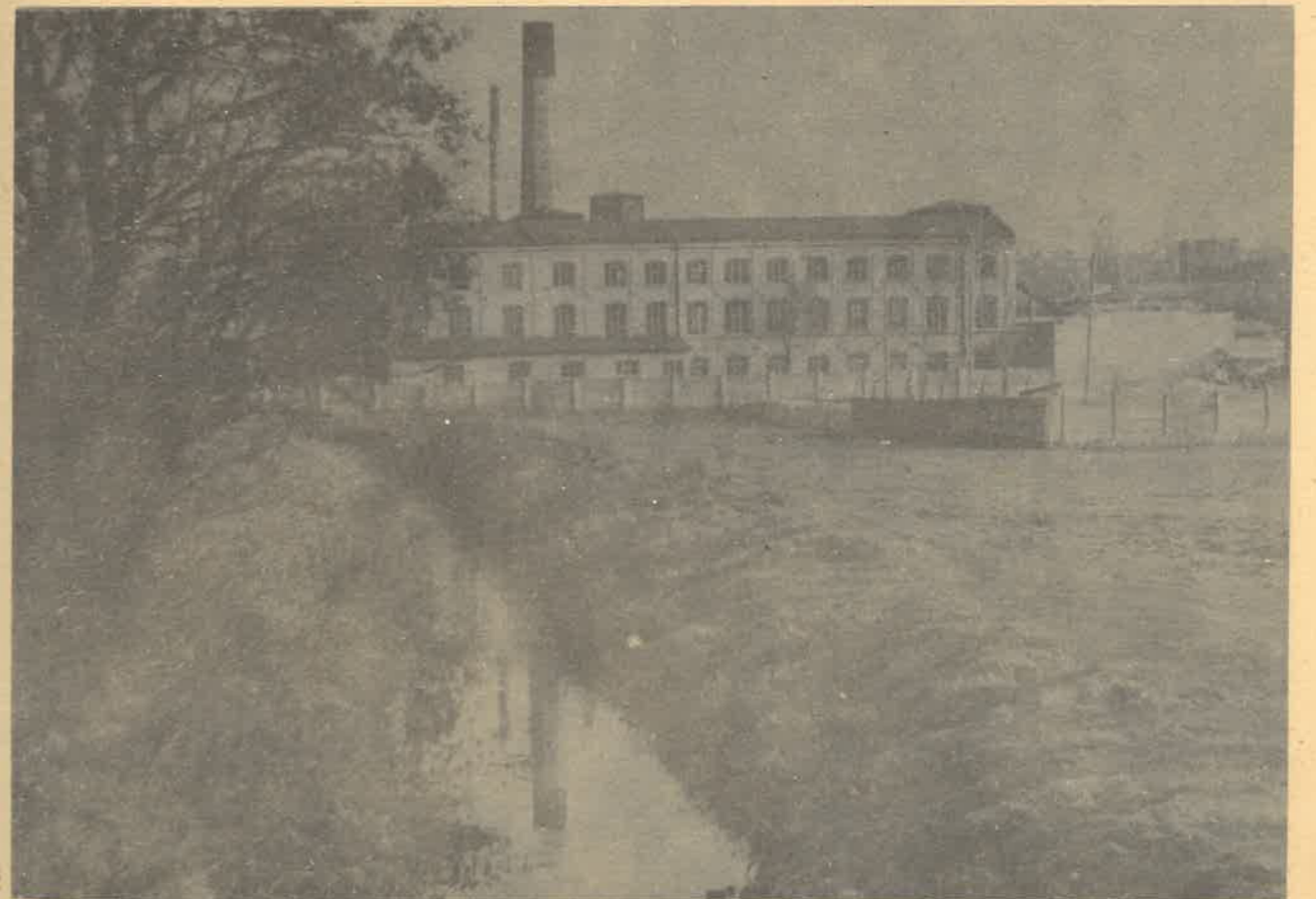
XIX-wieczna architektura przemysłowa Zgierza