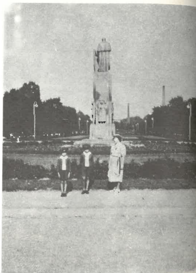
Pomnik Stanisława Moniuszki z lat międzywojennych