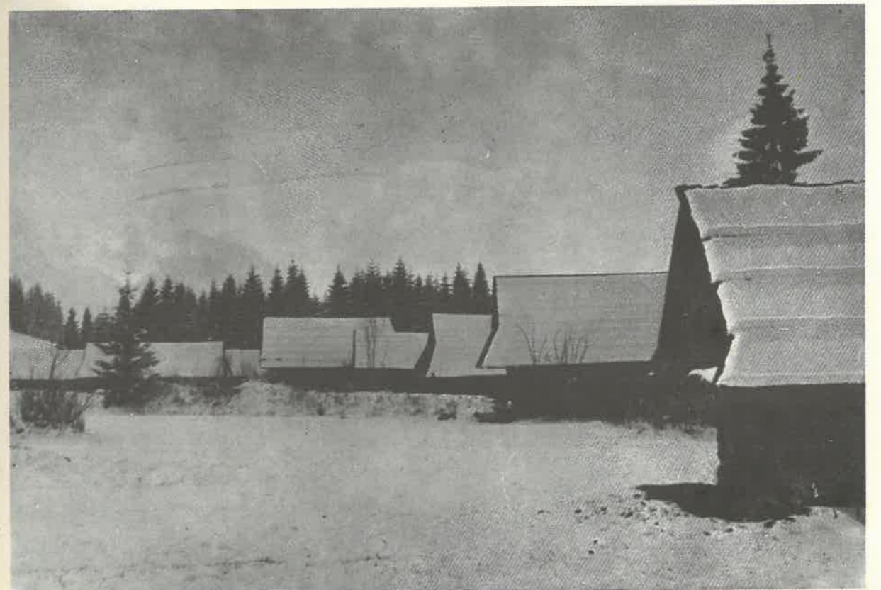
Uczestnicy III Łódzkiego Tygodnia Gór w Chochełowie