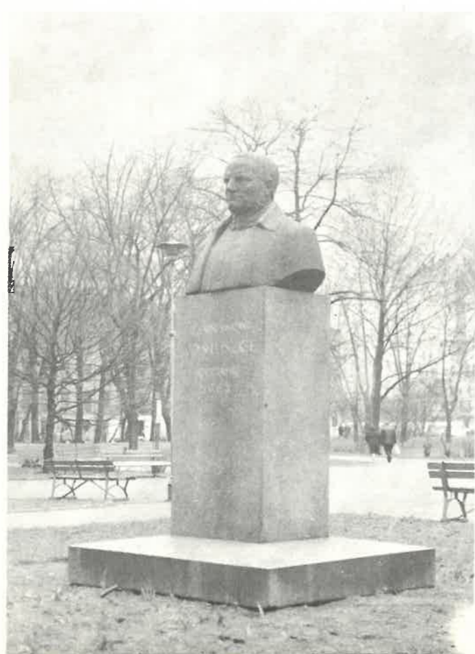
Pomnik Stanisława Moniuszki w parku przy ul. Narutowicz