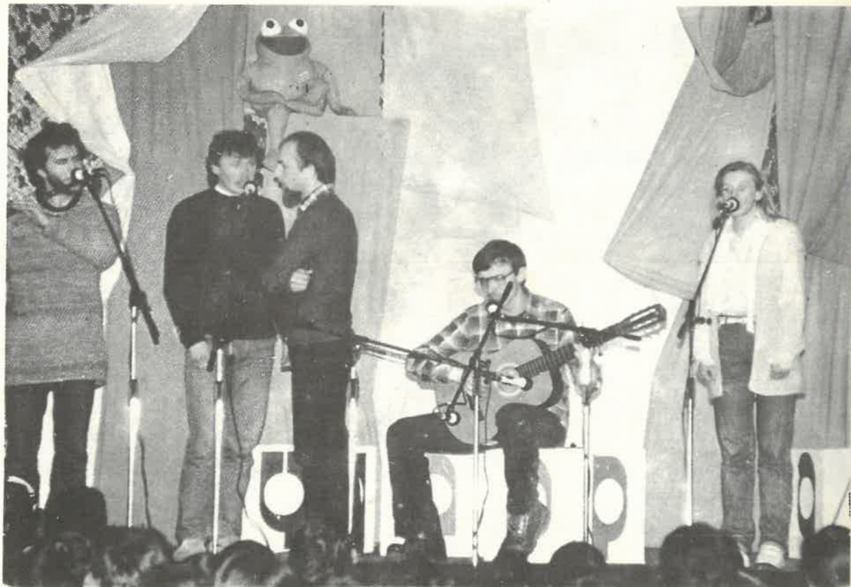
Najbardziej turystyczna grupa X YAPY — łódzki „WIBRAM”