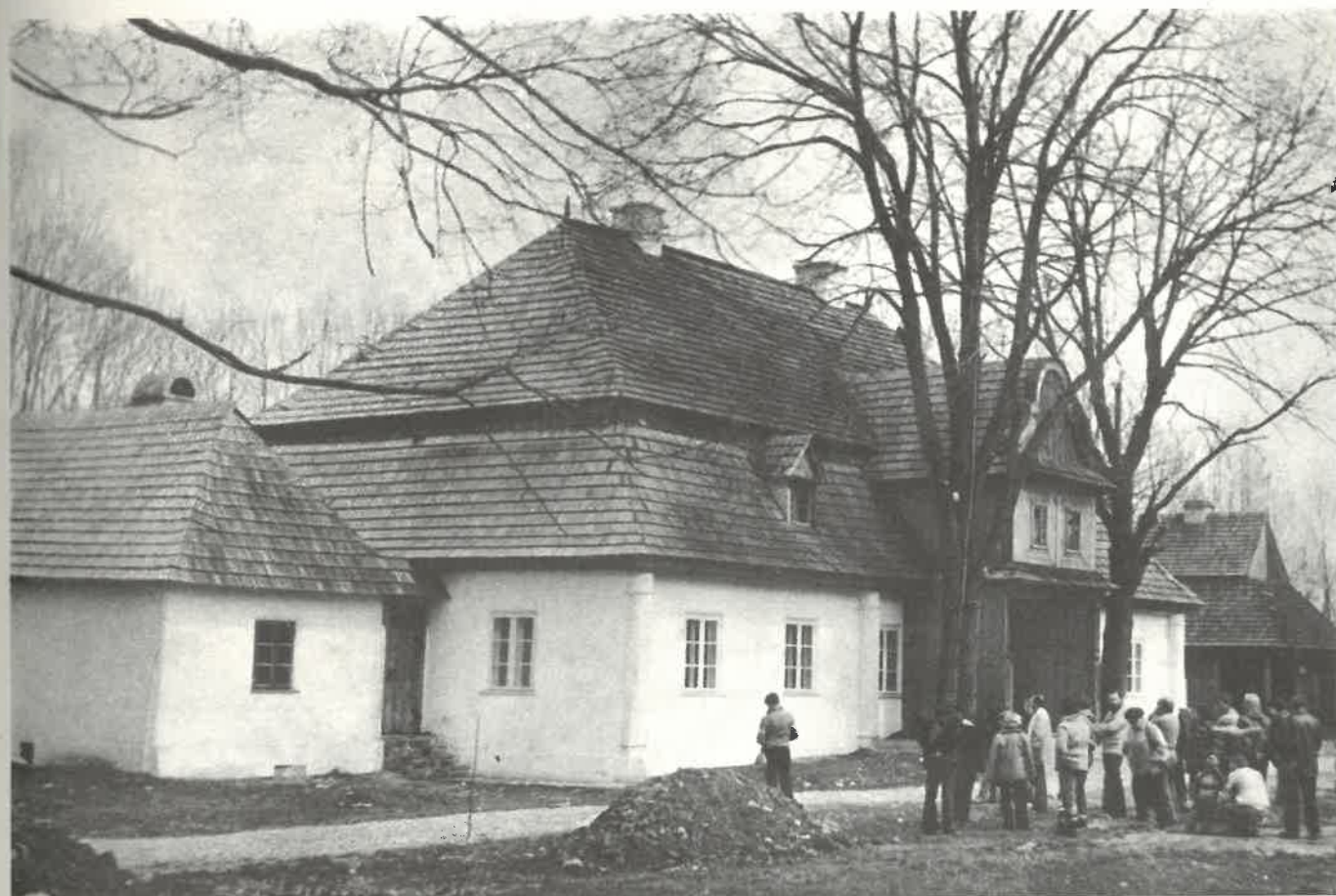
Uczestnicy III Łódzkiego Tygodnia Gór przed dworkiem w Łopusznej

Rok XXX Maj-czerwiec 1985 Nr III | 297 | 85