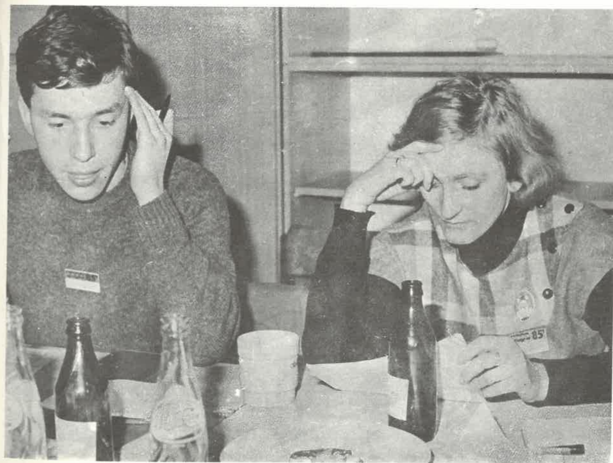
Jury przy pracy