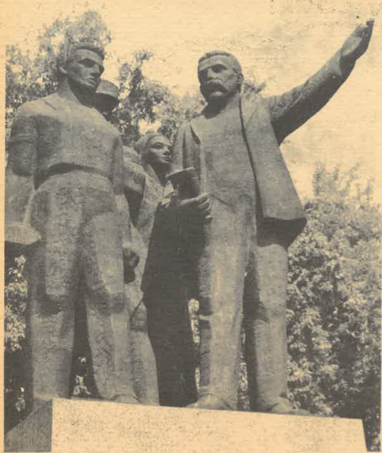
Pomnik Juliana Marchlewskiego