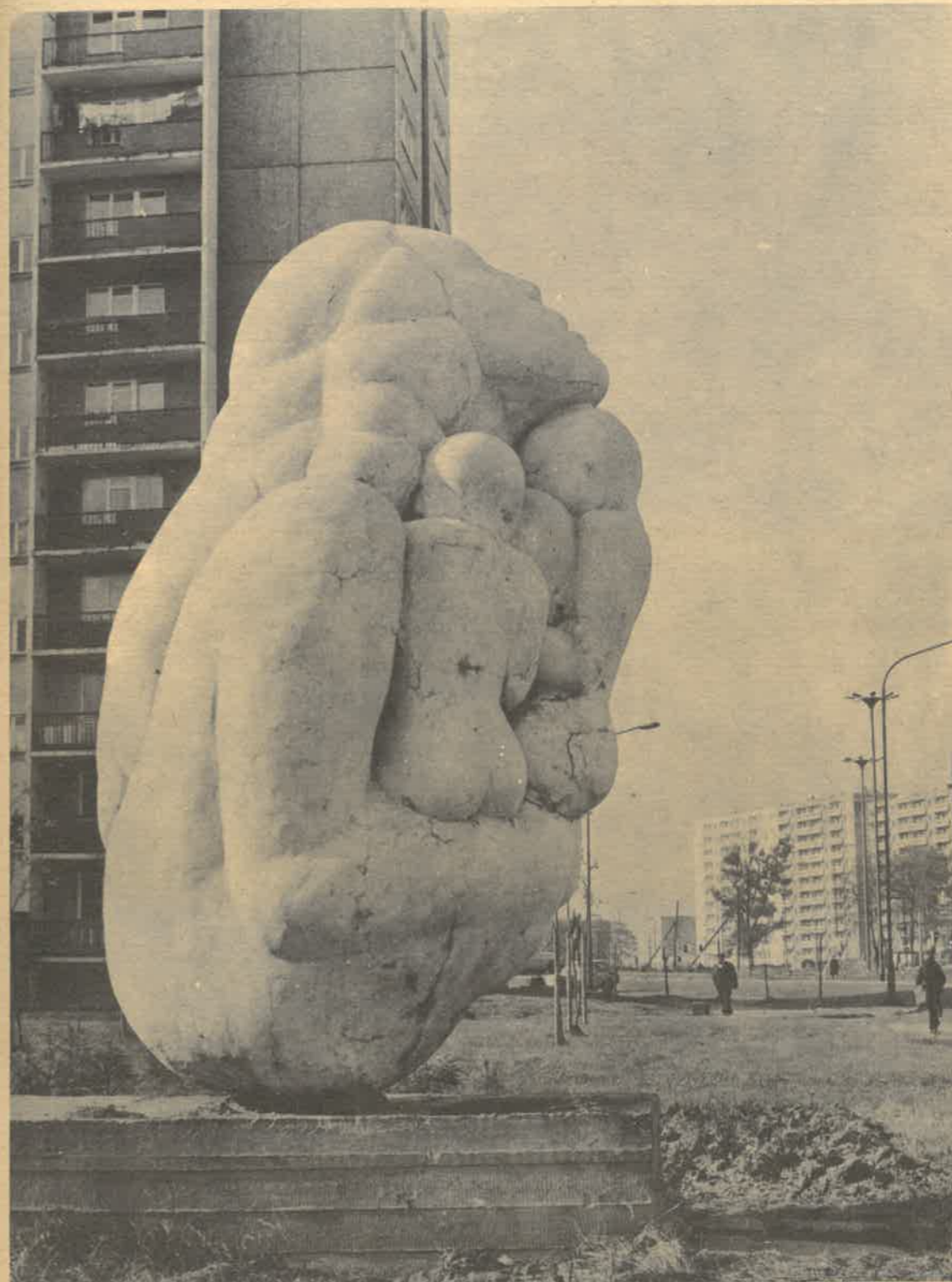
„Macierzyństwo” — rzeźba Michała Gałkiewicza ustawiona w 1976 r. przy ul. Thalmanna (osiedle Retkinia)

Numer zamknięto dnia 16 października 1984 r.