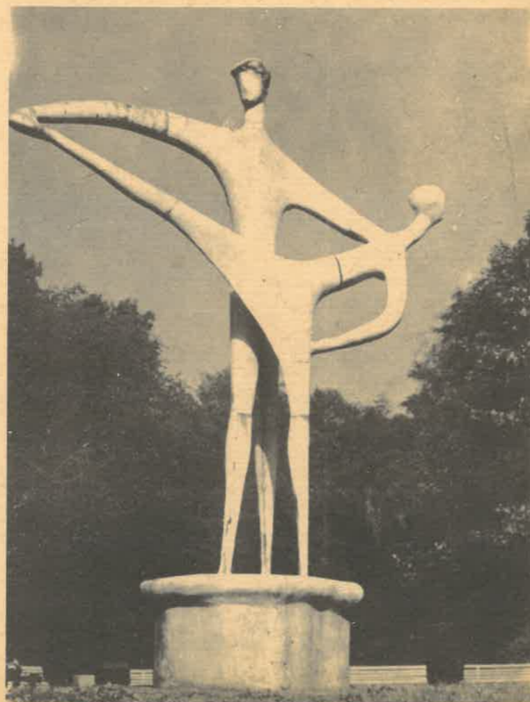
„Tancerze” — rzeźba ustawiona w 1976 r. w Parku Staszica z okazji Łódzkich Spotkań Baletowych