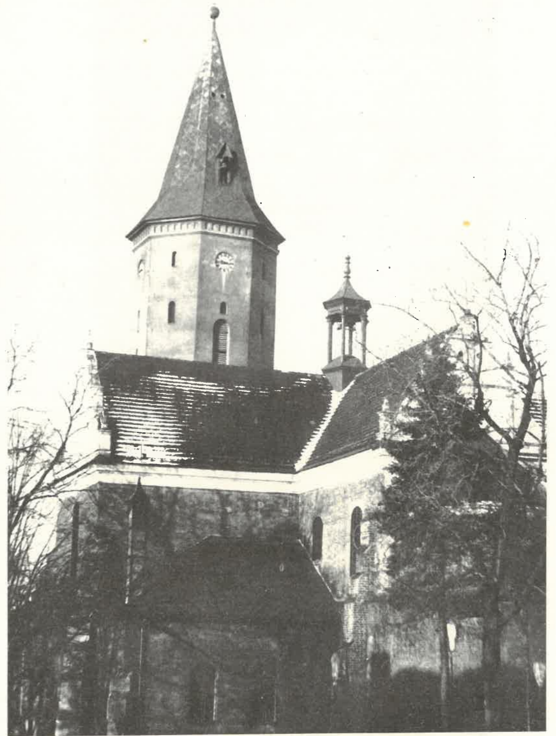
Kościół farny w Pabłanicach