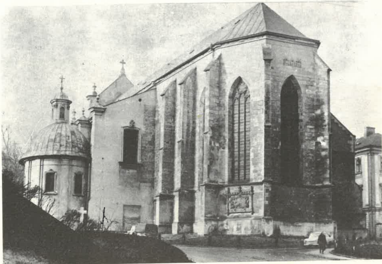
Katedra w Przemyślu