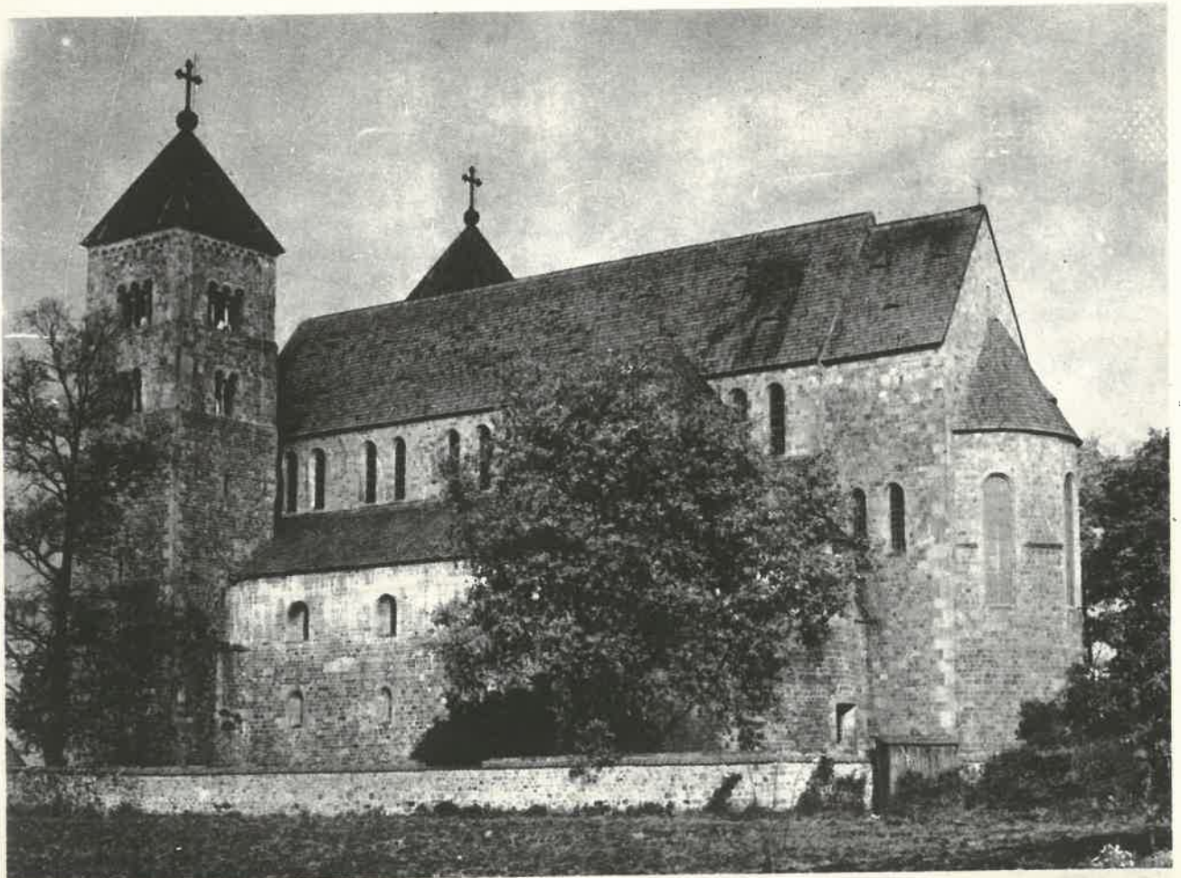
Kolegiata w Tumie

Rok XXX Wrzesień – październik 1985 Nr V | 299 | 85