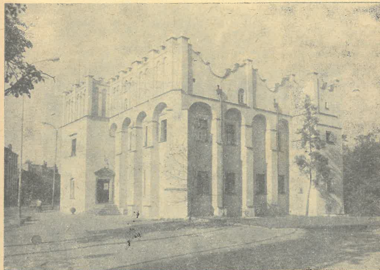
Siedziba Muzeum Miasta Pabianic