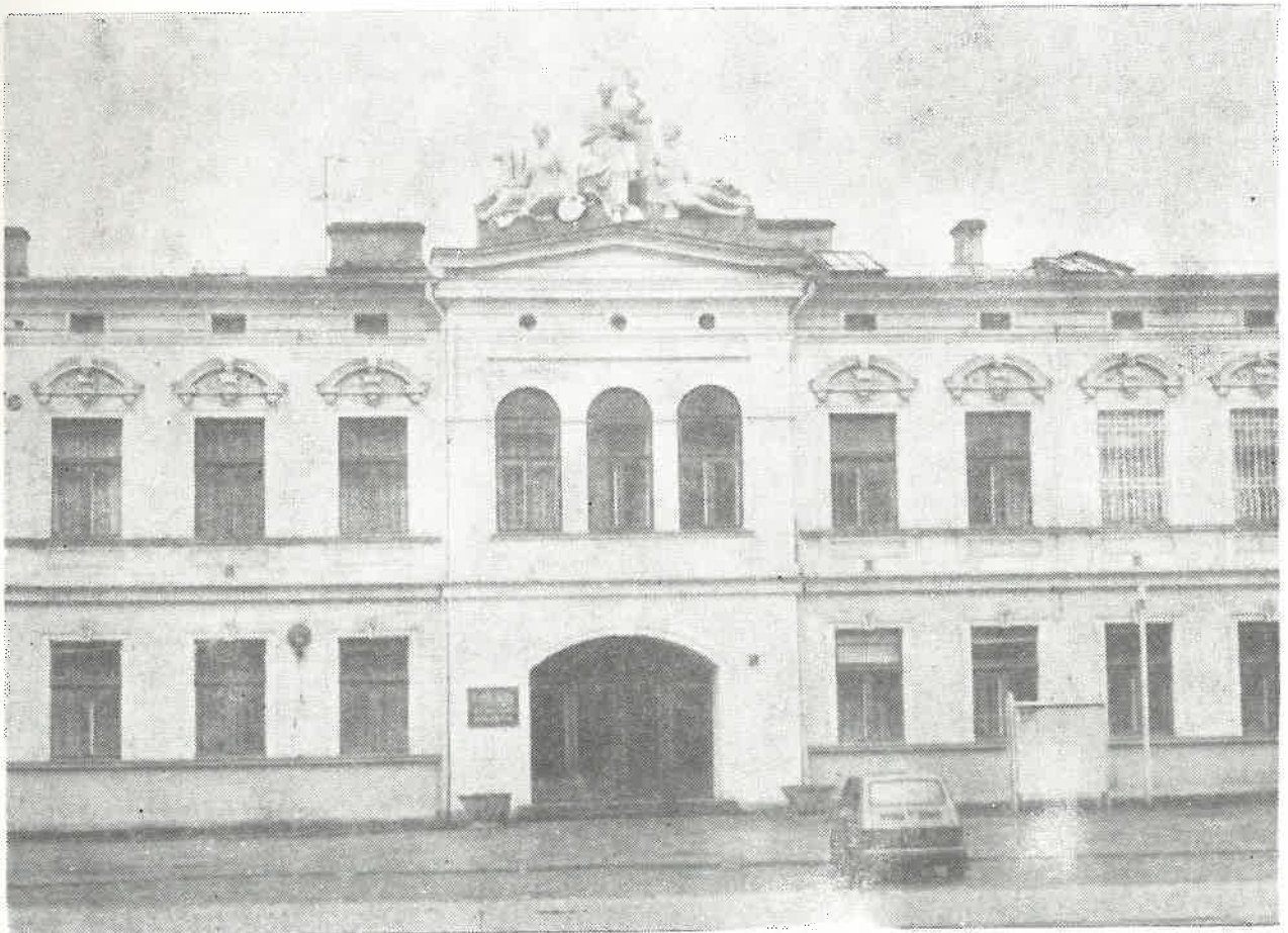
Fronton PZPB „Pamotex”