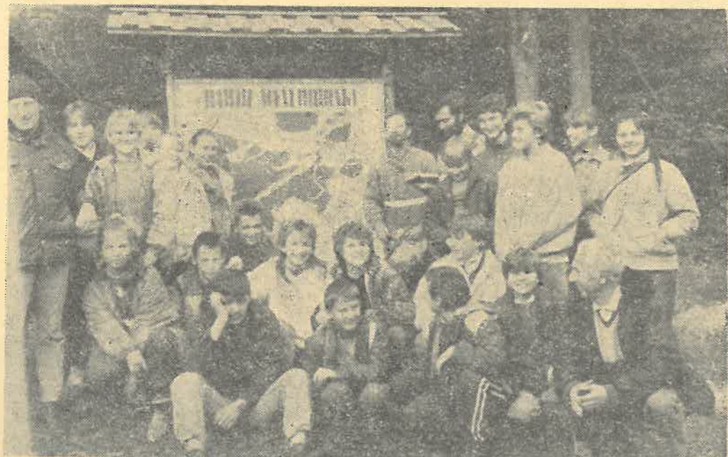
Przed wyjściem na trasę

Wiele miłych wspomnień pozostawiła trasa obrzeżem Gór Świętokrzyskich i Niecka Nidziańska ze zwiedzaniem rezerwatu Skalki „Piekło” pod Niekłaniem archeologicznego w Krzemionkach Opatowskich, Rezerwatu „Prześlin” i krasu gipsowego „Skorocice”, przejście pasmem Ociesęckim Gór Świętokrzyskich oraz Grzębami Bolimowskimi. Poznaliśmy Opatów, Wiślicę, ruiny ongiś pięknego zamku Krzyżtopór w Ujeździe. Na wycieczce w 1987 r. zwiedziliśmy ruiny 5 zamków na szlaku „Orlich