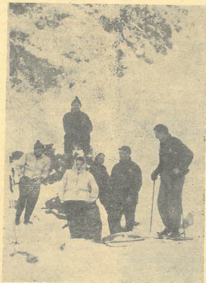
Nod Czarnym Stawem Gąsienicowym w 1954 r.