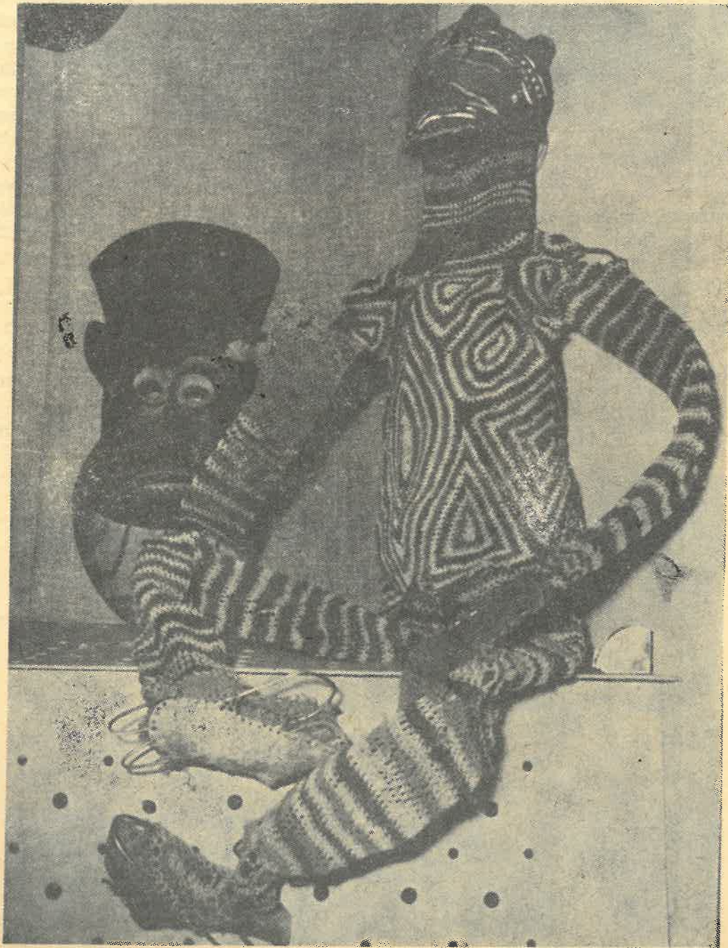
Rytualny kostium czarownika z Rodezji

Badaniom archeologicznym towarzyszą z reguły prace upowszechnieniowe w terenie, w muzeum i poza nim. Sprawozdania z badań