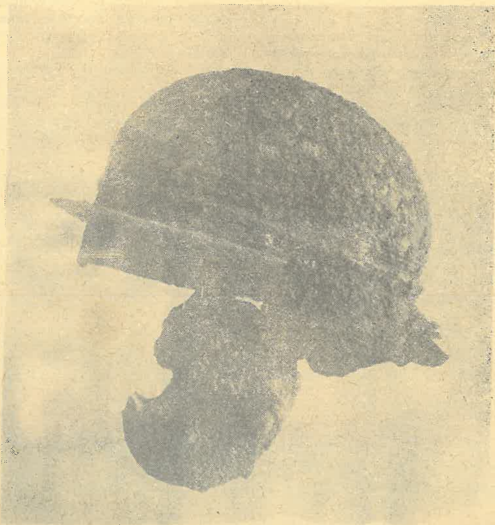
Żelazny hełm legionisty rzymskiego