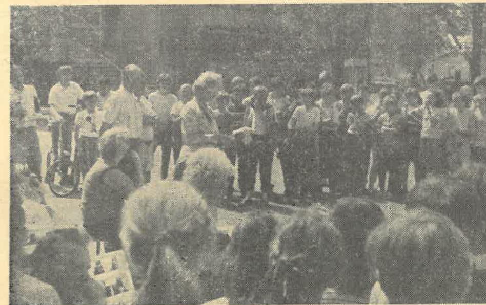
Zakończenie rajdu „Dni Pabianic”

Każda z omawianych wycieczek pozostawiła nie tylko wiele niezatartych wrażeń ale