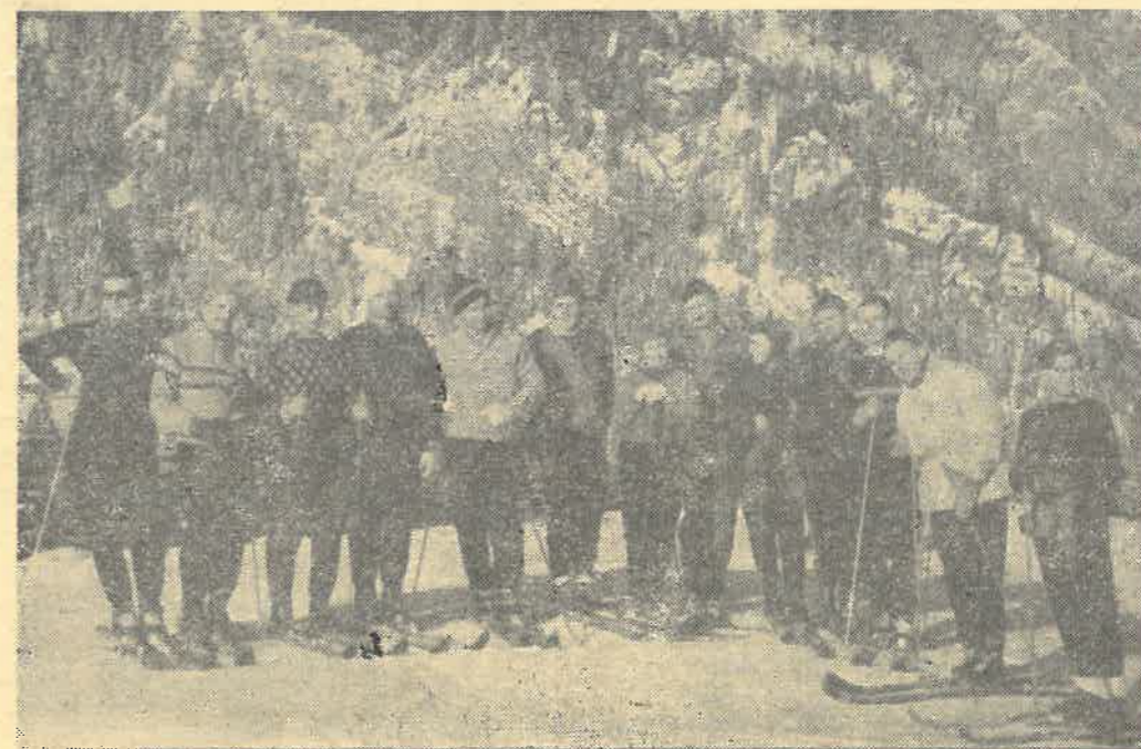
Na kursie narciarskim