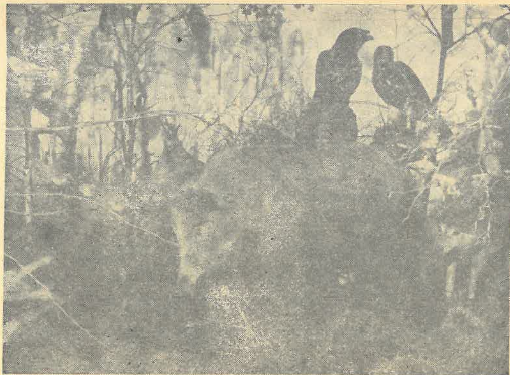
Fragment ekspozycji przyrodniczej