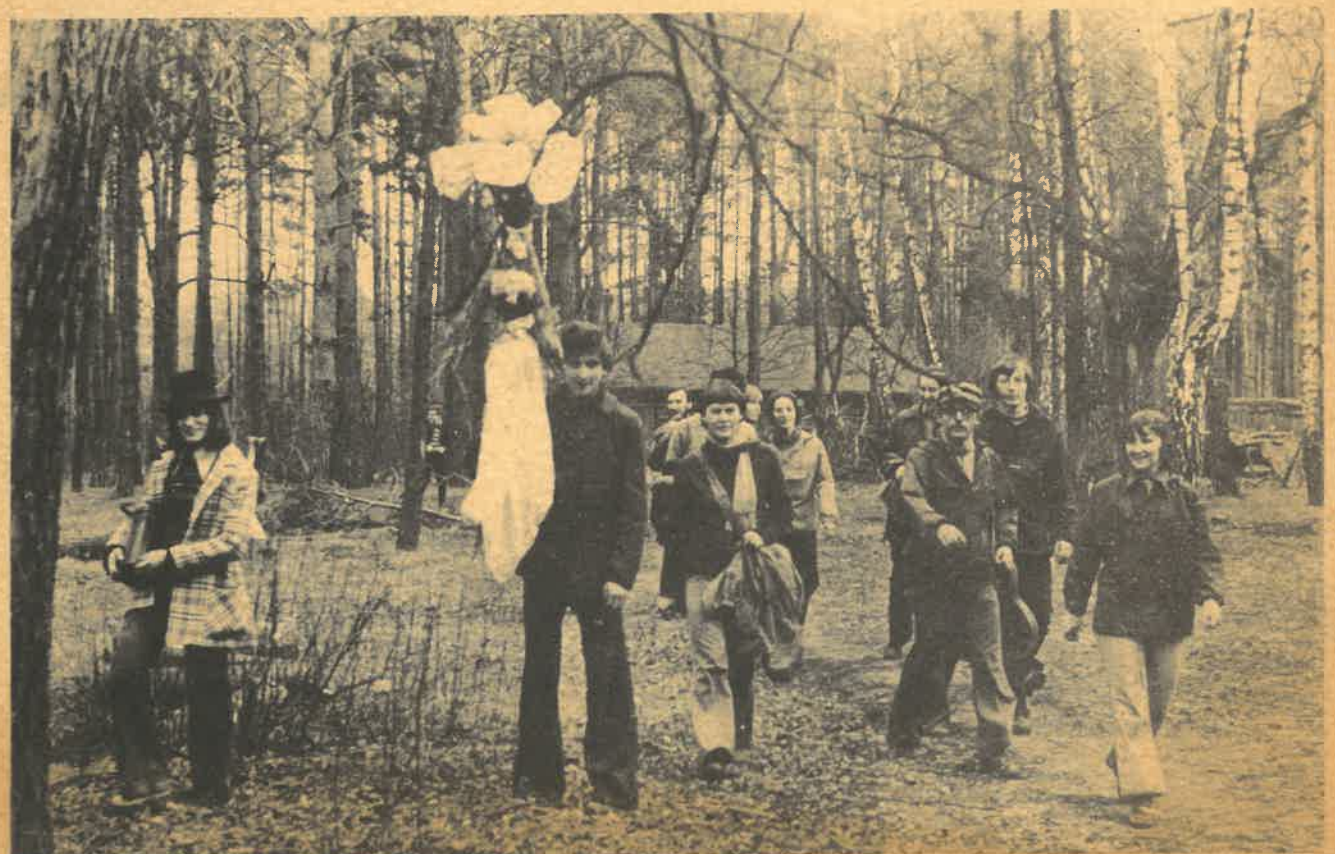
Studencka „Marzanna” 1977