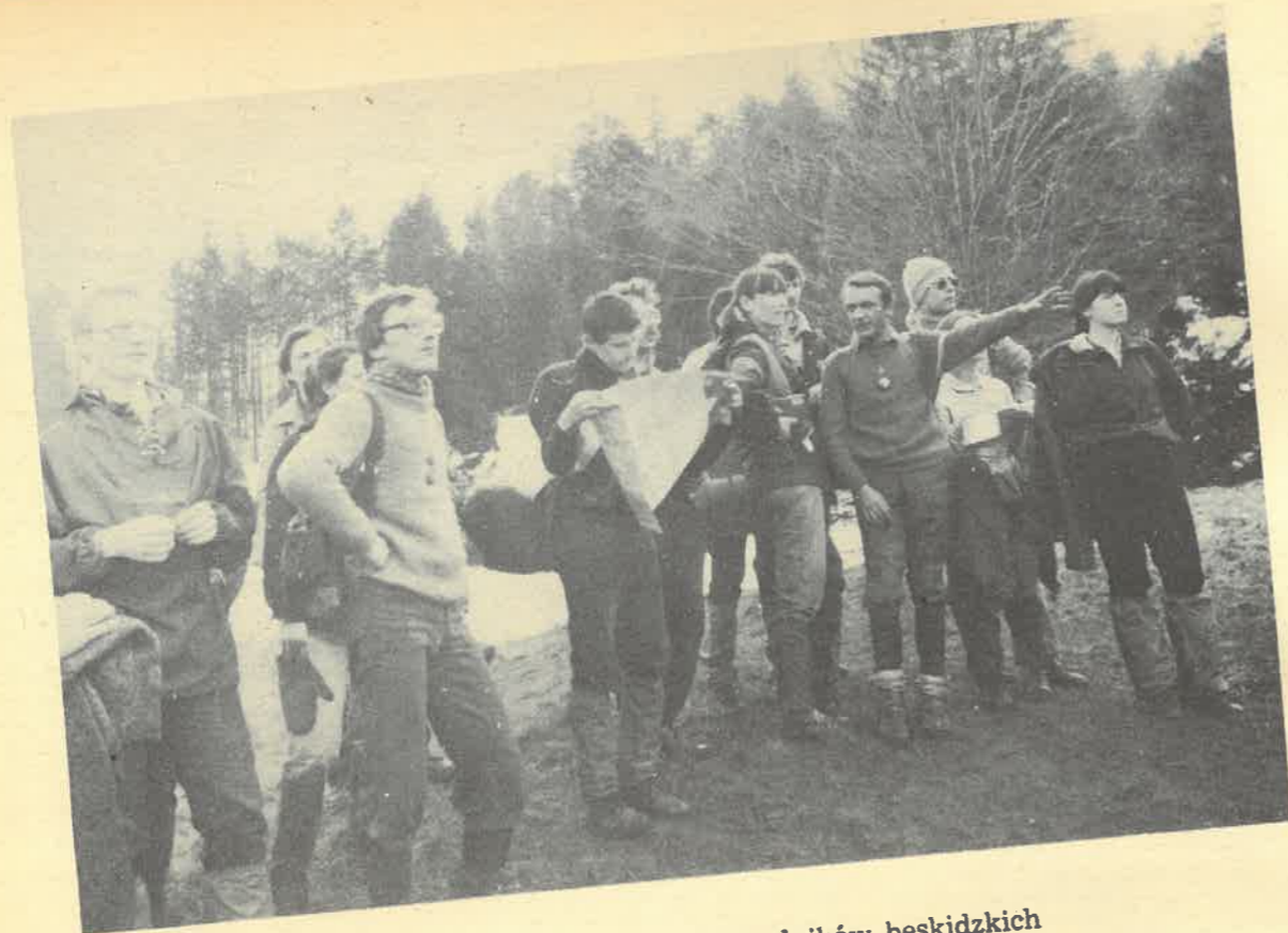
Obóz szkoleniowy kursu przewodników beskidzkich (pod Jaworzyną Krynicką)