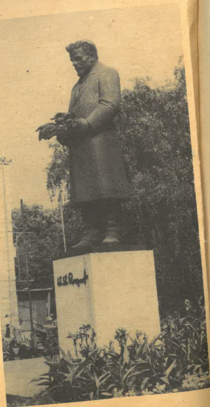
Pomnik Władysława Reymonta