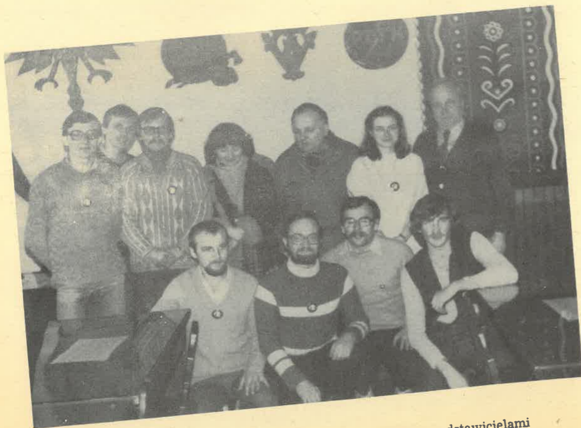
Świeżo upieczeni przewodnicy beskidzcy z Łodzi z przedstawicielami Komisji Egzaminacyjnej w Nowym Sączu