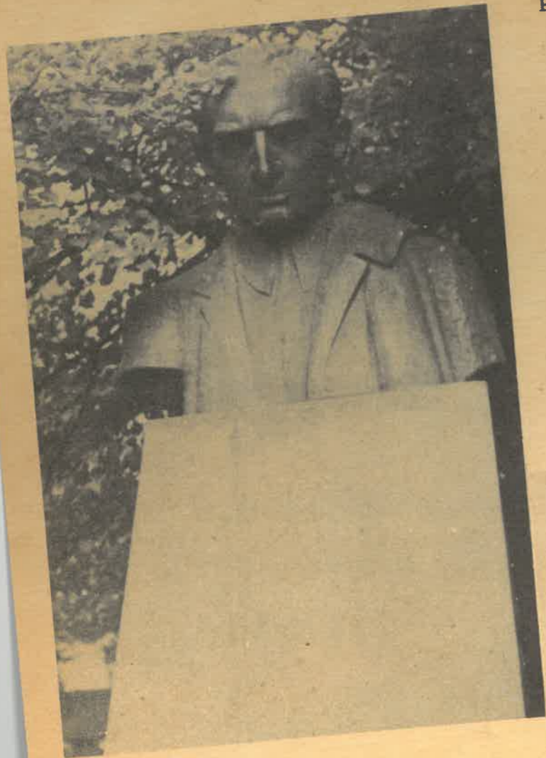
Pomnik Juliana Tuwima