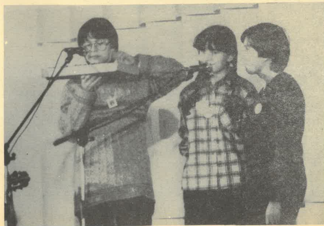
YAPA'83 Grupa „BRADELI” z Radomia