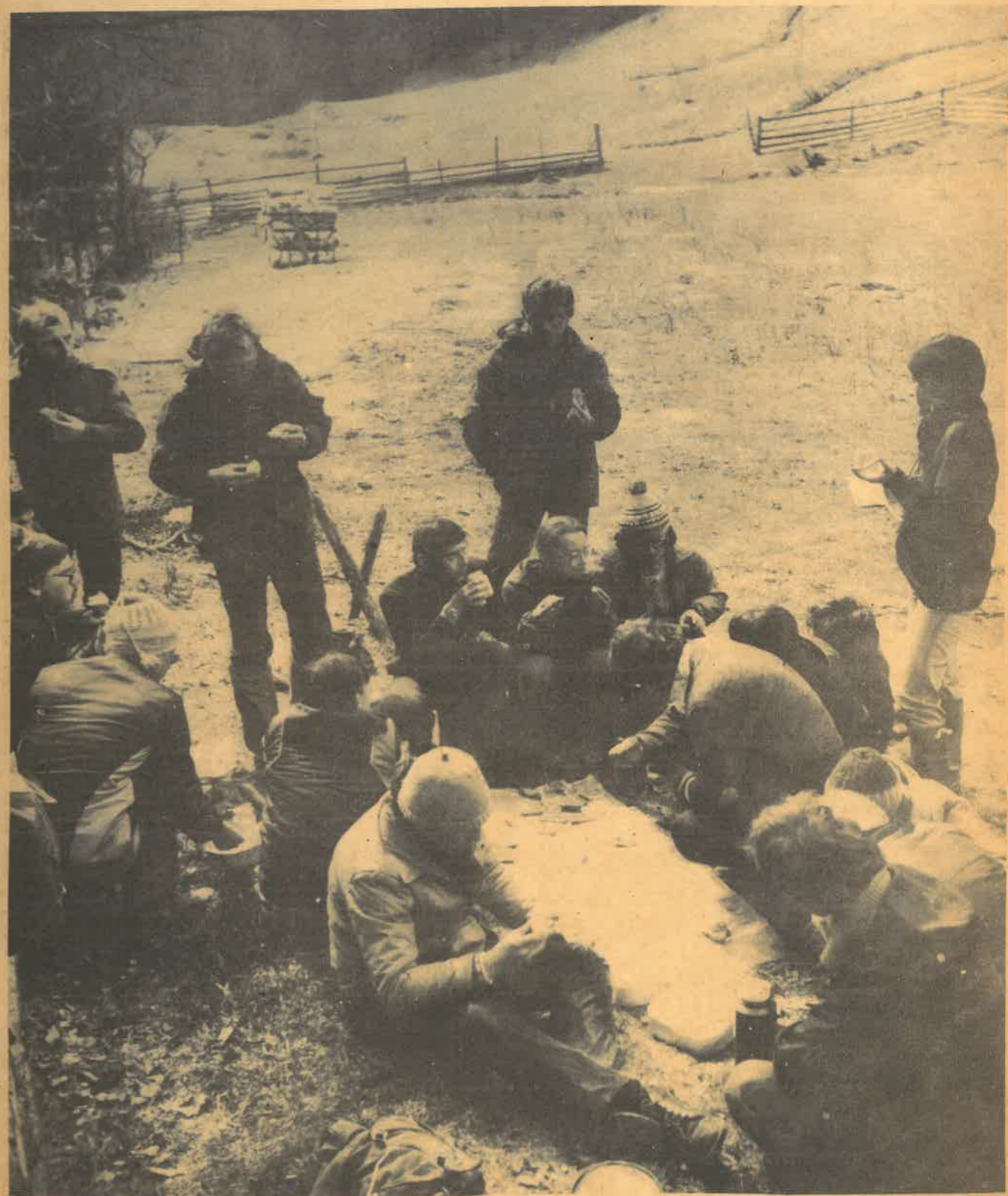
Obóz szkoleniowy kursu przewodników beskidzkich (Łomnica Zdrój, kwiecień 1982 r.)