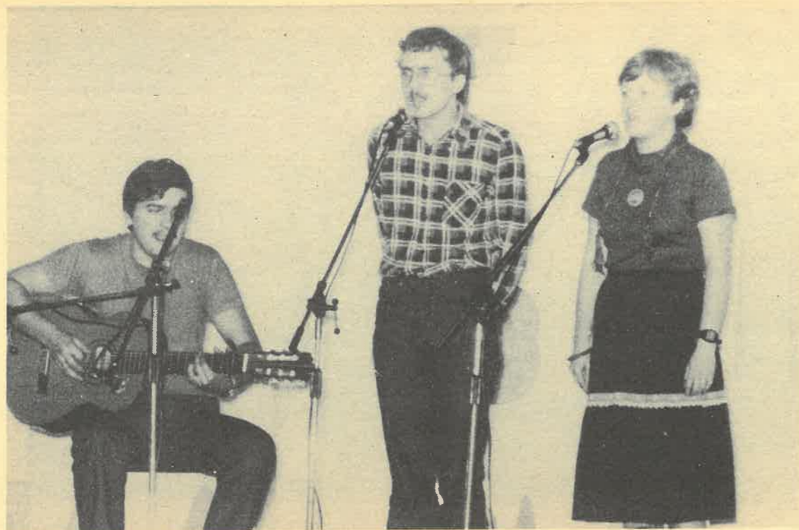
YAPA'83 Łódzka grupa „Po premierze”