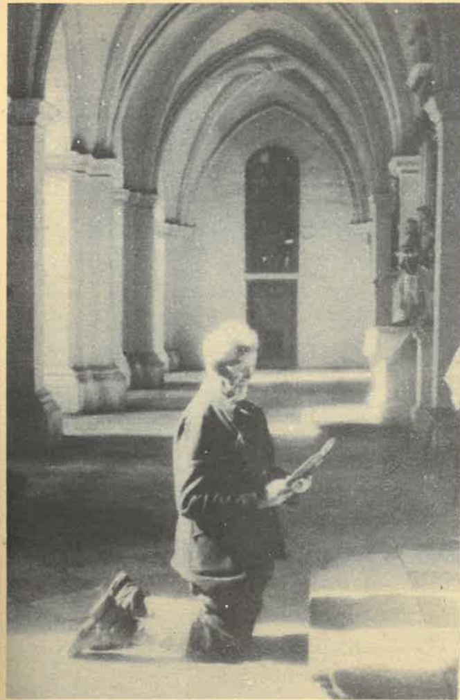
Dr Mieczysław Orłowicz w Paradyżu